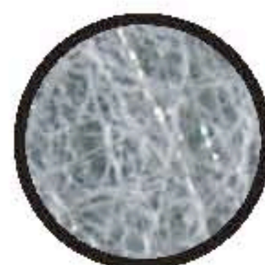
SKELNÁ ROHOŽ A HLINÍKOVÁ FÓLIE